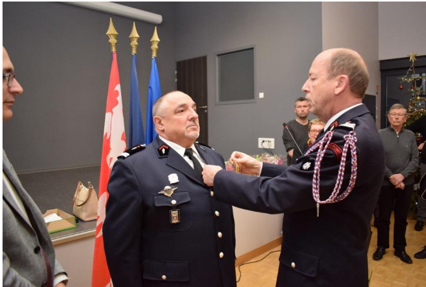
Médaille d'or des 30 ans d'engagement