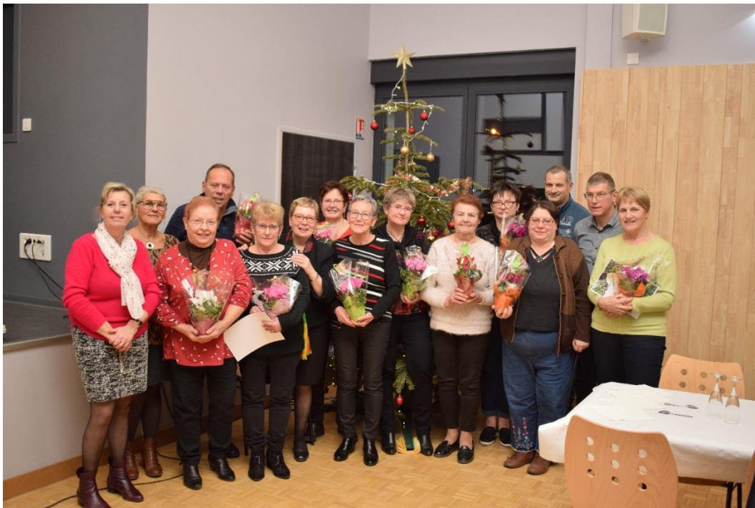
Les lauréats du concours des Maisons Fleuries

Chacun a reçu une plante fleurie et un bon d'achat offerts par la commune.