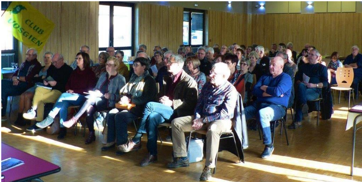
Une assistance nombreuse pour cette AG