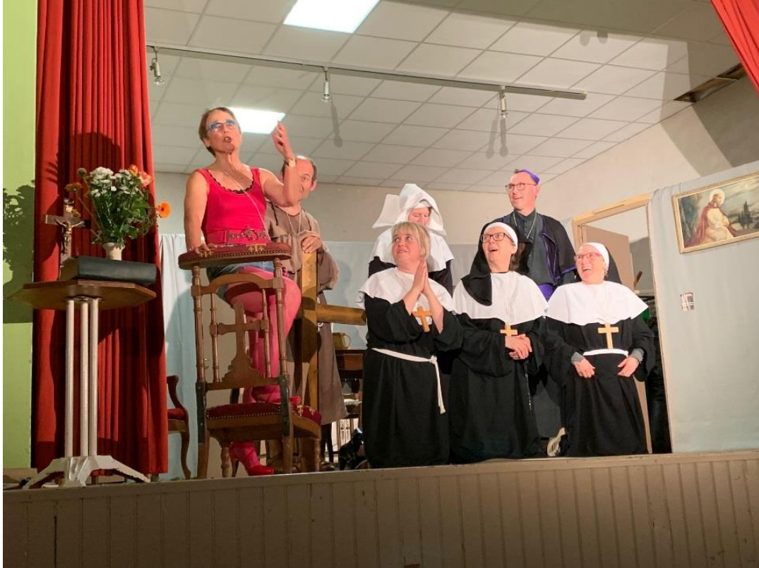
« J'y croi' pas »