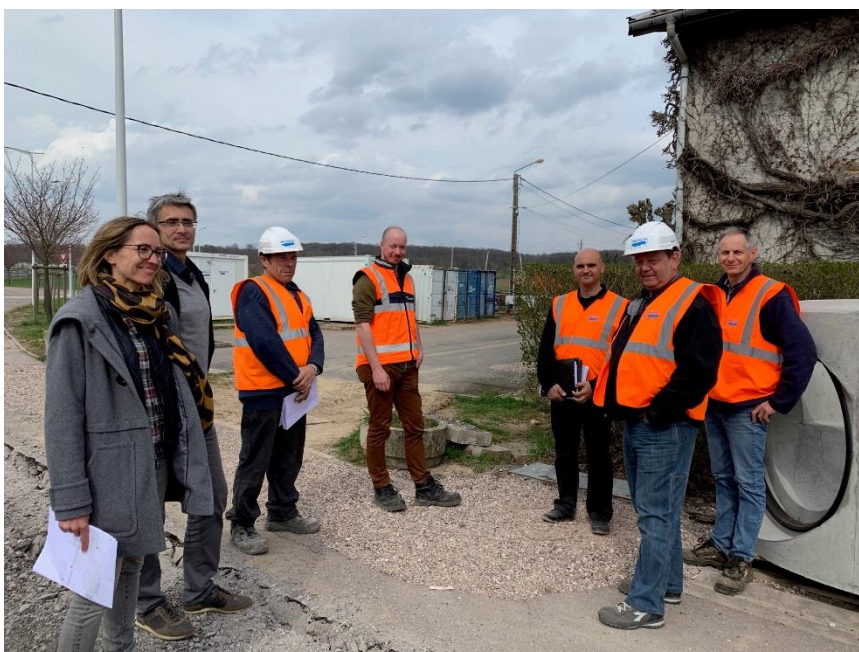
La réunion de chantier hebdomadaire

Le rabotage de la chaussée, côté pair, commence cette semaine, jusqu'au croisement avec la rue Hydro Leduc ; parallèlement, seront posées les bordures du côté impair. Mi juin devrait démarrer la finition des trottoirs. La fin du chantier est toujours prévue pour début juillet. Nous comprenons la gêne que crée ce chantier pour tout le village et vous remercions pour votre patience, vous tous qui subissez, d'une façon ou d'une autre, les conséquences, directes ou indirectes de ces travaux.